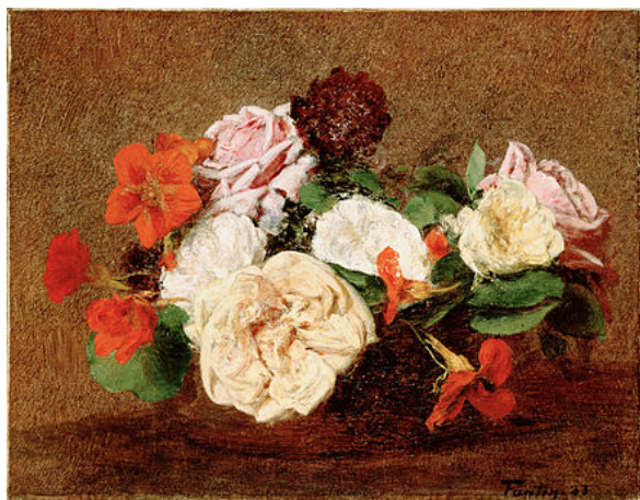
Roses et capucines dans un vase Henri Fantin-Latour 1883

La grande capucine a été introduite par des conquistadors hollandais vers 1680 en Europe où elle a fait son apparition dans les jardins de monastères et était tenue en haute estime en tant que plante aromatique et médicinale. L'éperon de la fleur de capucine rappelle le capuchon de l'habit de moine, ce qui peut donner à penser que son nom serait dérivé de celui des moines capucins.